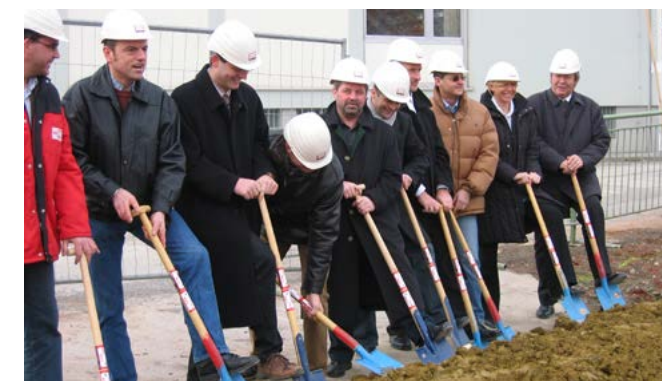
Spatenstich für das Rüsthaus St. Ruprecht a. d. R.

Im gleichen Jahr fand die Eröffnung des neuen Wellnesscenters mit Beautybereich durch Familie Ochensberger statt. Nach Abbruch des alten Rüsthauses erfolgte der Spatenstich für das neue Gebäude der Freiwilligen Feuerwehr am 02.03.2006.