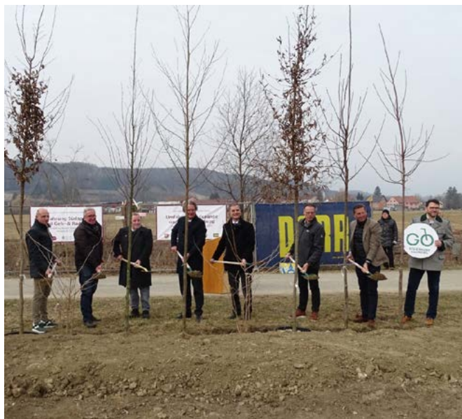
Spatenstich der Südspange

Da derzeit die Wehrversammlungen unserer vier Feuerwehren stattfinden, möchte ich betonen, dass wir Gemeindeverantwortlichen versucht haben, für die Anliegen unserer Feuerwehren immer ein offenes Ohr zu haben. Ich kann stolz behaupten, dass alle vier Wehren tolle Rüsthäuser, dem letzten Stand der Technik entsprechende Fahrzeuge und eine dementsprechende Ausrüstung haben. Das ist aber das Mindeste, das wir für unsere ehrenamtlich tätigen Frauen und Männer tun können. Es sollte von der Bevölkerung nicht als selbstverständlich angesehen werden, dass sie zu jeder Tages- und Nachtzeit und bei jeder Witterung für uns alle da sind. Dafür von meiner Seite ein herzlicher Dank.